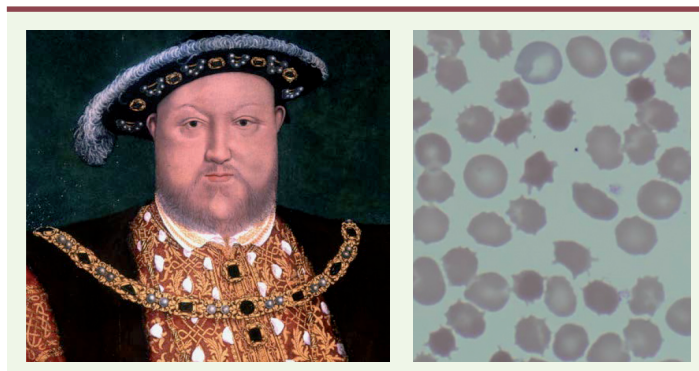
Figure 1. Henri VIII. Henri VIII d'Angleterre aurait souffert du syndrome de McLeod mais ceci n'a jamais pu être formellement démontré [9]. Quant aux acanthocytes, ils donnent de magnifiques images en microscopie électronique. Encore faut-il penser à les rechercher sur un frottis sanguin ! [10].

Le patient est régulièrement suivi par la même équipe de neurologie depuis deux ans et continue de souffrir de son intolérance à l'effort et de myalgies. Il a été déclaré inapte au travail. Ses paramètres cliniques et biologiques restent stables. Il ne se dégrade pas au niveau cognitif et ne présente aucun mouvement anormal. Il n'a pas fait de décompensation psychiatrique. La maman décédée entre temps n'a pu être analysée au niveau moléculaire tout comme les filles du patient qui, pour l'instant, se refusent à toute analyse biologique.