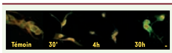
Figure 1. Trafic nucléocytoplasmique du GR et de SRC-1 dans les cellules de Schwann. Le GR (fluorochrome rouge) et SRC-1 (fluorochrome vert) réalisent un trafic nucléocytoplasmique et sont localisés dans le cytoplasme des cellules « témoins ». Au bout de 30 minutes d'induction par les glucocorticoïdes, GR et SRC-1 entrent dans le noyau. Une fraction de SRC-1 ressort du noyau au bout de 30 heures de traitement des cellules par les glucocorticoïdes, probablement pour être dégradée par le protéasome.

p300, ce qui pose un problème de sélectivité hormonale. Plusieurs questions ont été posées : le GR recrute-t-il au hasard les p160 ou bien des paramètres externes comme la nature du ligand, le contexte cellulaire ou le promoteur cible peuvent-ils guider ce recrutement ? Nous avons montré que la localisation des p160 était différente dans les astrocytes et les cellules de Schwann et dépendait