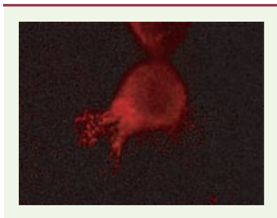
Figure 1. Concentration de la MMP7 (matrix metalloproteinase 7) à l'extrémité d'un lamellipode de cellule de carcinome de côlon humain Isreco-1 en culture.