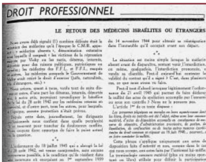
Le Concours Médical , 20 septembre 1945.

Analysis of a well-known medical journal, the Concours Médical reveals the attitude among the French medical corps between 1940 and 1944. This journal kept its readers informed of the various stages of xenophobia and anti-Semitism under the Vichy government. It provided the decisions adopted, and the application of measures prohibiting foreign and Jewish physicians to practice, regularly publishing lists. Analysis of the editions published under the occupation clearly shows the xenophobia and anti-Semitism that existed among a certain population of French practitioners. ♦