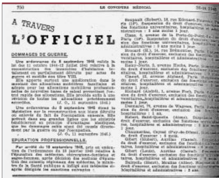
Le Concours Médical, 30 septembre 1945.