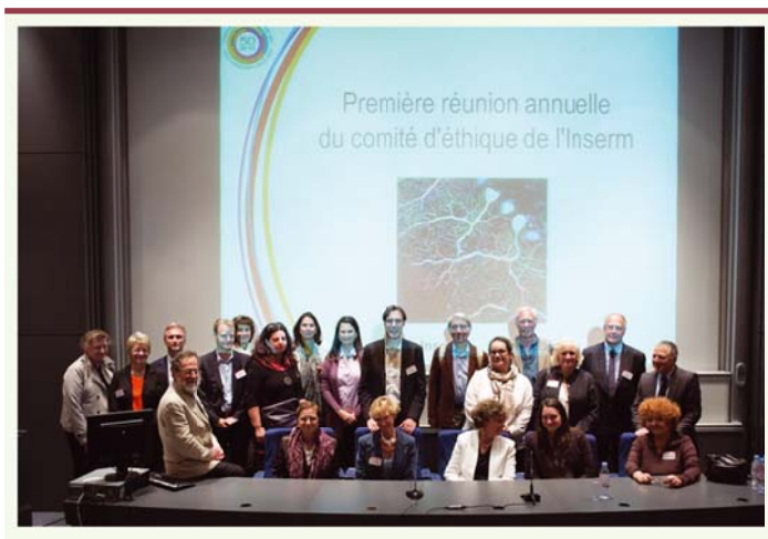
Figure 3. Le comité d'éthique de l'Inserm.

qui en sont issus sont un état de l'art des connaissances scientifiques et médicales internationales sur le sujet. Elles apportent l'éclairage nécessaire aux prises de décisions en matière de soins, de dépistage et de prévention.