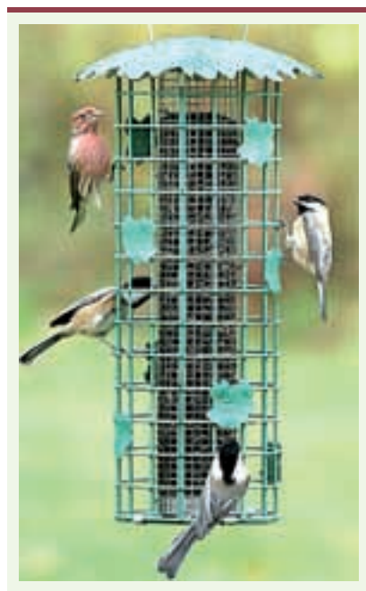
Figure 3. Mangeoire à silos.

Il est intéressant, dans ce cas, de voir qu'un groupe a préféré les frimas anglais avec leurs avantages : un trajet plus court et une nourriture équilibrée, quelles que soient les variations climatiques. Là encore, on ne peut parler d'une