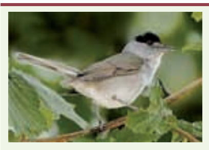
Figure 2. Fauvette à tête noire ( Sylvia atricapilla ) mâle.

quoique de très petits oiseaux (comme les colibris) puissent aussi effectuer de très longues distances 2 ;