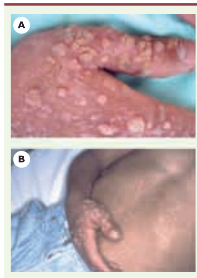
Figure 1. Définition de la maladie à HPV. A. Verrues vulgaires observées chez neuf patients, en nombre supérieur à 30 et existant depuis plus de deux ans. B. Lésion de type d'épidermodysplasie verruciforme observée chez quatre patients sur neuf, caractérisée par des verrues planes réfractaires au traitement et par des macules hyper- ou hypopigmentées mimant un pityriasis versicolor.

Nous avons donc recherché quel(s) pourrai(en)t être le(s) facteur(s) de risque de survenue de maladie grave à HPV dans ce groupe de patients. Le seul facteur de risque identifié est le type moléculaire à l'origine du DICS. Seuls les patients présentant un DICS avec lymphocytes B présents et cellules NK absentes (DICS B + NK - ) développent une maladie à HPV. Les caractéristiques de la TCSH (compatibilité entre le donneur et le receveur, type de conditionnement) et les événements secondaires à la TCSH (réaction du greffon contre l'hôte, infections) ne semblent pas intervenir sur le risque de survenue de la maladie à HPV. Par ailleurs, à distance de la greffe, ni le type de chimérisme ni la qualité de la reconstitution des immunités T et B ne diffèrent chez les